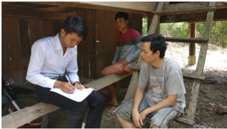
Figure 4 Sim haastattelee sokeaa Krusa FM kuuntelijaa Kambodzassa