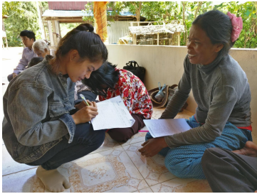
Figure 3 Davan haastattelee lukutaidotonta Krusa FM kuuntelijaa Kambodzassa