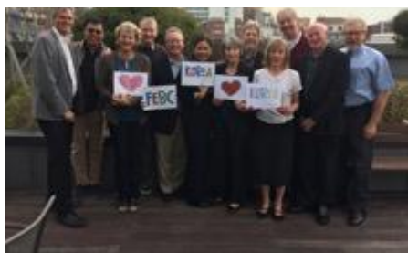
Figure 4 FEBCin palvelutiimillä johon kuulun oli retriitti Soulissa