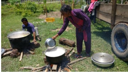
Figure 3 Perheseminaarin ruokapadat – riisiä ja kalakasvislientä