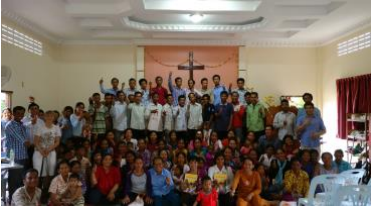
Figure 2 Perheseminaarilaiset