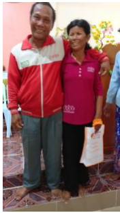
Figure 4 Perheseminaariin osallistunut pari